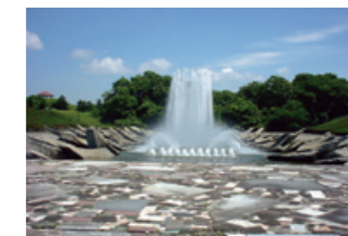
水景システム 「癒し・潤い・安らぎ」の水景の創造