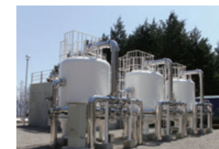
エコスイング 高効率ろ過器。長期間安定した水質を確保