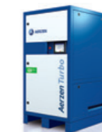
EJターボ 省エネ型のブロワ。消費電力を30%削減