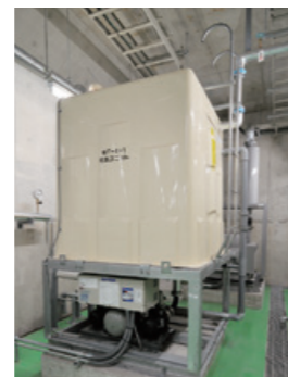
給水ユニット 地下施設などで生活に必要な 水を供給

国内屈指の環境総合エンジニアリング企業「荏原製作所」の トップクラスの販売代理店である当社は、創業以来半世紀 を超える緊密なパートナーシップのもとに、建築・食品・ 薬品・化学・繊維・鉄鋼・半導体・電力などの分野に向け て営業を推進。ポンプ、送風機、空調冷熱機器、水処理装 置など、定評のある「荏原」ブランドの商品を提供してい ます。商品を知り尽くした当社の施工ノウハウも評価され、 日本全国で豊富な販売実績を誇っています。