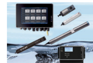
スペクトロライザ 光を使って複数の水質項目を連続で監視する装置