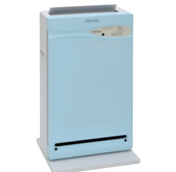
MAC-1000 オゾン殺菌効果で室内の感染リスクを低減する室内消毒器