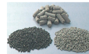
ポエフ 土壌に含まれる腐植質に着目して開発した脱臭剤

産業廃棄物や一般ゴミの減容と再利用は、環境保全における大きな課題となっています。当社は、バイオの力で廃棄物をリサイクルしCO 2 削減にも貢献する「バイオマスプラント」や、機械動力を必要としない乾燥装置「CCドライヤー」などを開発。各種工場廃液や食品廃棄物などの乾燥・減容化、資源再利用に貢献することで、循環型社会構築の一翼を担っています。