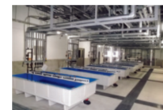
水産設備 水産設備をトータルコーディネート