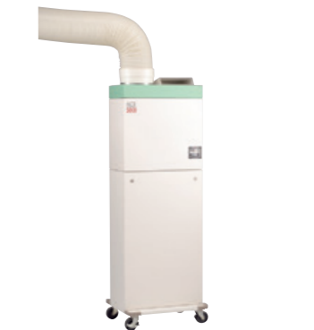
ACE-5000 通常の病室が陰圧の隔離病室として生まれ変わる病院用空気清浄機