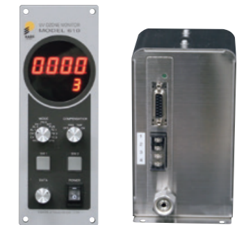
EG-610 半導体製造装置に組み込まれるオゾンモニタ