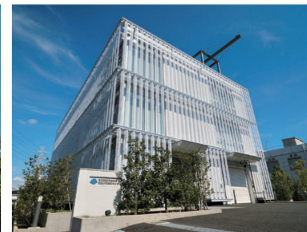
環境計測技術センター