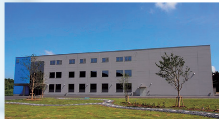
かずさ生産技術センター