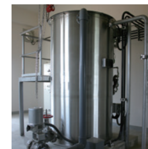
ポエフリアクターシステム 臭気の抑制と汚泥改質により汚泥を緑農地に還元