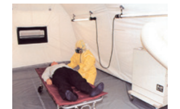
ACE-4000・エアータント 多目的空気清浄機と感染症対策用陰陽圧式エアータントのセット使用