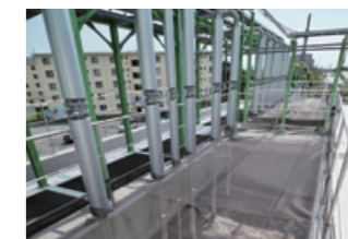
産業廃水処理施設 水質に応じた浄化設備を提供

国や都道府県が運営する栽培漁業センターや水産試験場等では、当社の水質保全・防疫システムを応用した技術が活躍。魚介類のふ化・育成の生存率を高め、より豊かな食生活の実現に貢献しています。また、うるおいのある生活環境の創造に向けて、親水公園や池などの水景施設や、人々の心を癒す水族館でも、当社の水浄化技術が活躍しています。