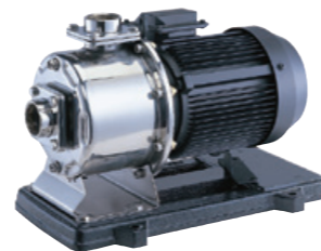
ポンプ エバラ 多段渦巻ポンプ