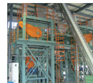
ドライヤー 資源再利用のため食品廃棄物などを乾燥・減容化