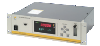
EG-3000 大気測定やプラント監視など幅広く対応する高精度オゾンモニタ

病院などの医療機関でも、オゾンの優れた除菌力が注目されています。当社では各種医療・福祉施設などにおける院内感染防止用の空気清浄機など、オゾン技術を応用したさまざまな製品を開発し、健康な暮らしの実現に貢献しています。